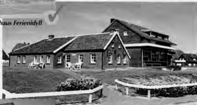
Insulanerhaus Nr. 21

Baltrum, das "Dornröschen der Nordsee", lädt ein zu Entspannung pur. Kein Auto stört die Urlaubsgäste auf der kleinen ostfriesischen Insel. Genießen Sie die weiten Dünenlandschaften, das angenehme, heilsame Nordseeklima und schalten Sie ab von der Alltagshektik: Ob im Aktiv-, Kur- oder Faulenzerurlaub, auf Baltrum erwarten Sie erholsame Tage.