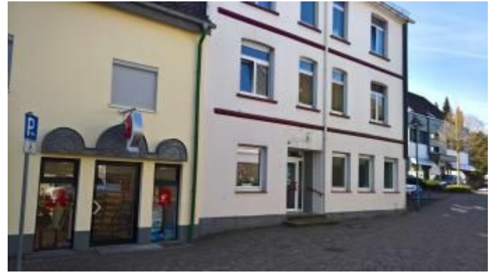
Eingang Zum Marktplatz 6

Als gute Möglichkeit boten sich die Räumlichkeiten des Friseursalons Ceolan an, die allerdings erst Anfang August bezogen werden konnten.